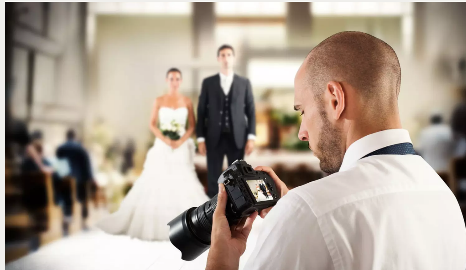
Photographes / Videastes